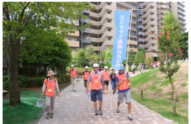
④ 避難訓練 (2)