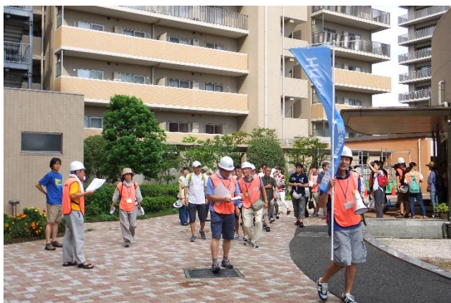
③ 避難誘導訓練 (1)