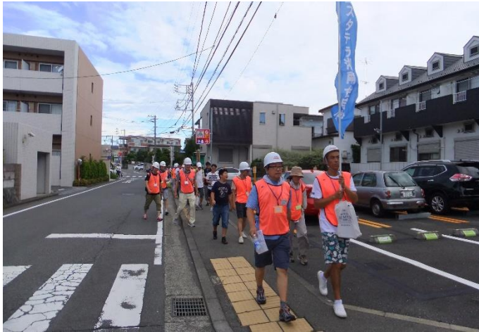
⑤ 避難訓練 (3)