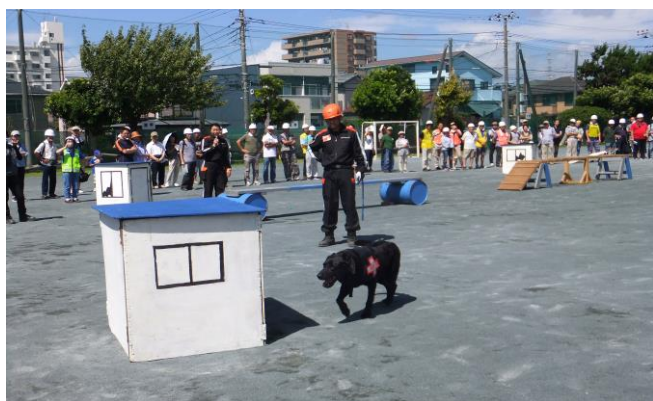
⑰ 救助犬による救出訓練 (1)