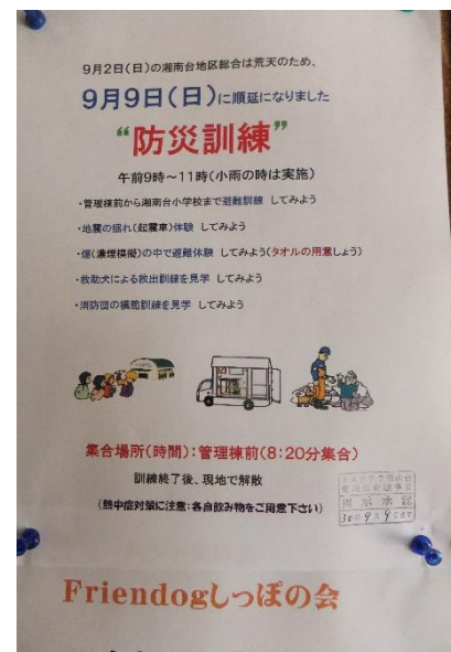
② 9月2日荒天の為、9日に順延