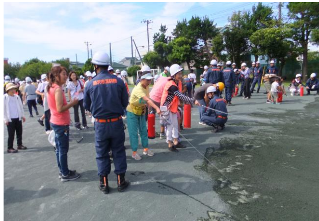
⑭ 水消火器を使った消火訓練