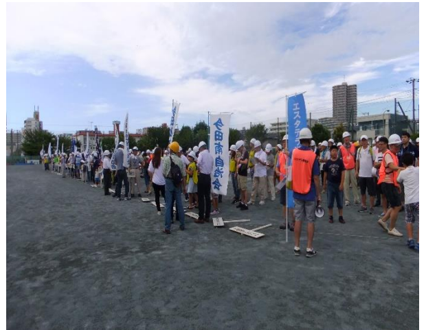
⑥ 避難先の湘南台小学校に到着