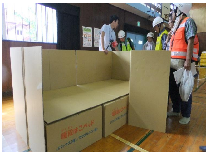
⑨ ダンボール製の「ベッド」です