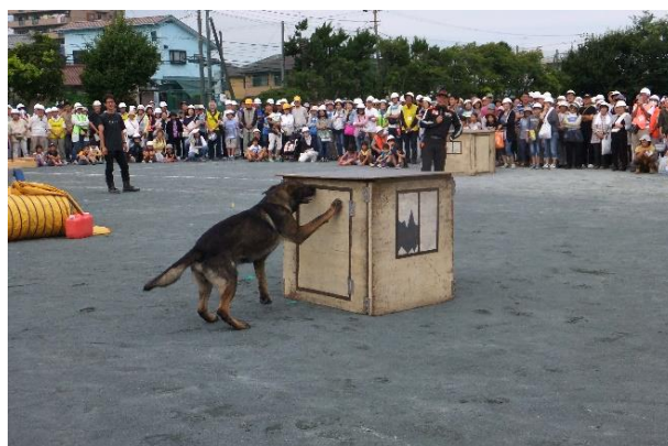
⑱ 中には子供さんが救出を待っています (2)