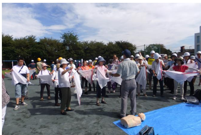
⑮ 三角巾を使った応急手当の方法