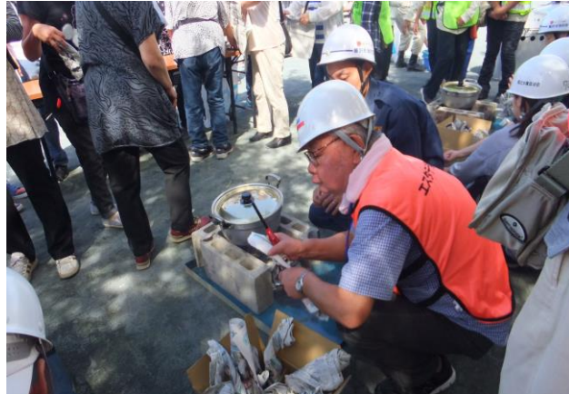
⑯ 災害時の非常食の炊き出し訓練 新聞紙を丸めて燃料にします