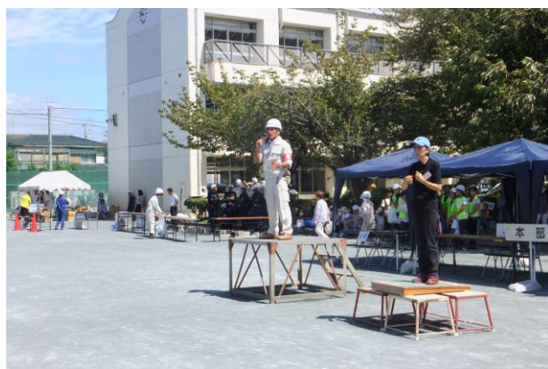
⑳ 危機管理課による防災講和

災害は何時起こるか分かりません。 特に地震と火災は大きな被害につながる可能性があります。 災害を避けて通ることが出来ません。 私達は常日頃から、何時やってきても対応出来る準備をしておくことが、 大事になってきます。 エステテラ湘南台の自主防災訓練や、湘南台地区総合防災訓練を通して 「防災意識の高揚」を図っておきましょう。