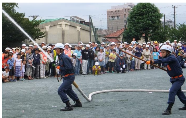
⑲ 第17消防分団による模範訓練