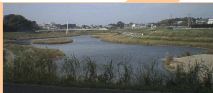
自然創出ゾーン(ピオトープ) 遠方には 鷺舞橋