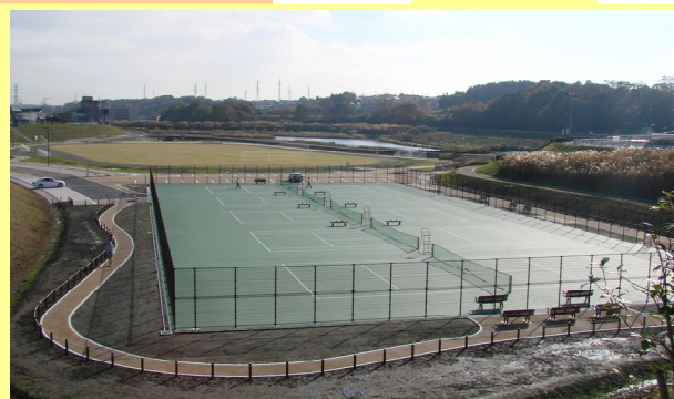
完成した 多目的グラウンド(奥)とテニスコート(手前) (2009/11/25 完成)