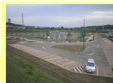
少年野球場(A,B 2面あります)