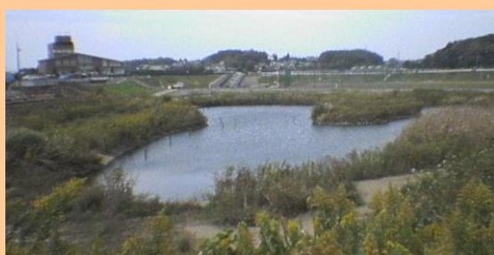
自然創出ゾーン(ピオトープ)