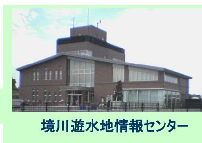
境川遊水地情報センター