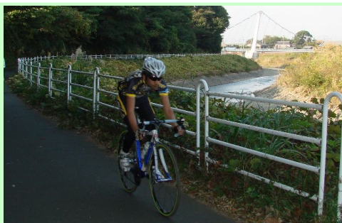
藤沢大和自転車道(境川サイクリングロード)